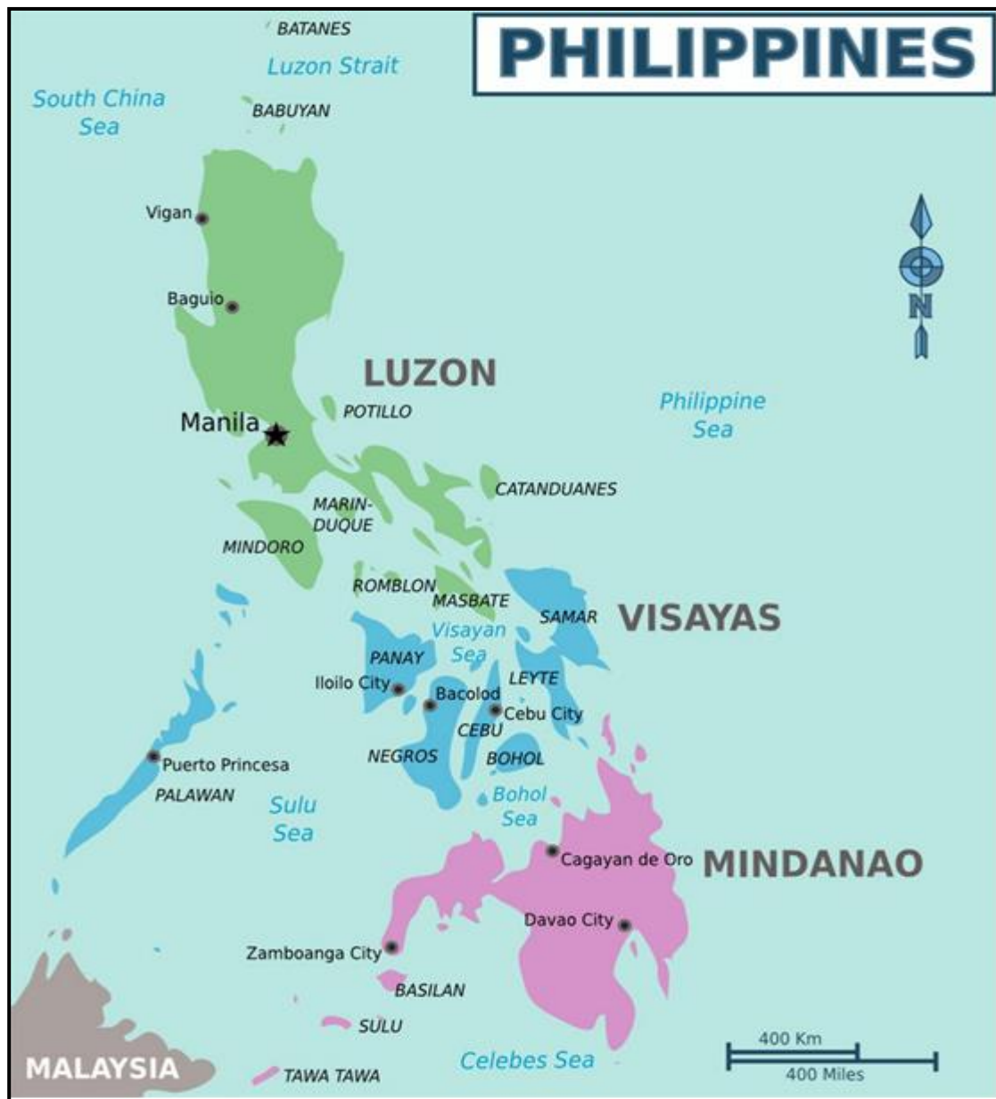
Εικόνα 1: Χάρτης των Φιλιππίνων